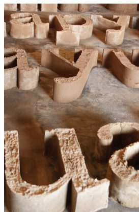
Obra de Bernardo Oyarzún

A 8ª edição da Bienal do Mercosul – Ensaio de Geopoética, iniciada no dia 10 de setembro, com programação até 15 de novembro. Reúne obras de 107 artistas de 34 países, sendo 38 brasileiros e 15 gaúchos, que tratam de tópicos relevantes para essa discussão, como mapeamento, colonização, fronteira, aduana, alianças transnacionais, construções geopolíticas, localidade, viajantes científicos, nação e política. A Bienal leva artistas, obras, exposições e atividades pedagógicas a Bagé, Caxias do Sul, Ijuí, Montenegro, Pelotas, Santa Maria, Santana do Livramento, São Miguel das Missões e Teutônia. Em Porto Alegre, serão realizadas as exposições Geopoéticas e Cadernos de Viagem, no Cais do Porto, Além Fronteiras, no Margs, e a mostra do artista homenageado, o chileno Eugenio Dittborn, no Santander Cultural. Outros nove locais do centro da capital abrigarão a exposição Cidade Não Vista . Confira a programação em http://www.fundacaobienal.art.br .