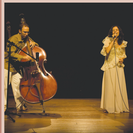
Canções de Edith Piaf