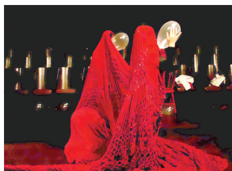
Trabalho de Élcio Rossini