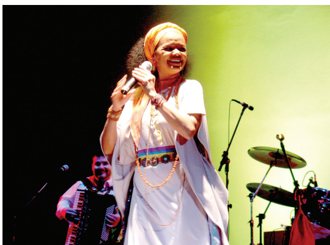
Cantora Loma se apresenta dia 14

Kinoshita no show Pampa Esquema Novo , selecionado no Edital 2012/1.