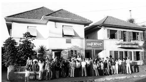
Trincheira: equipe do Coojornal em frente a sede, em 1979